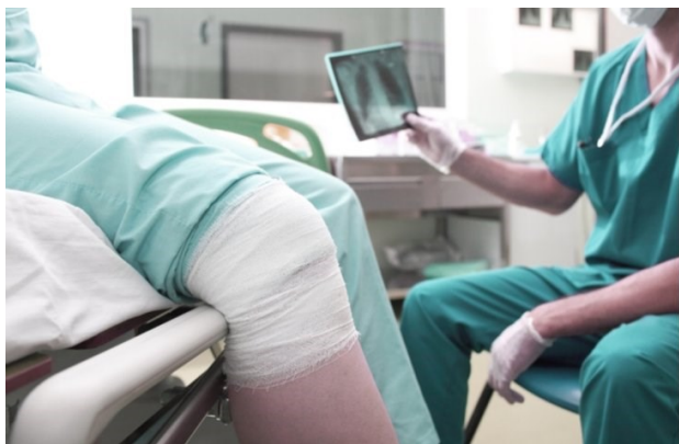
ADVERTISING