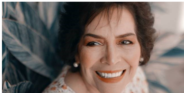
ilustrační fotografie

Jak to mají s daňovými povinnostmi ženy pobírající vdovský důchod a muži pobírající vdovecký důchod? Kdy se důchod zdaňuje?